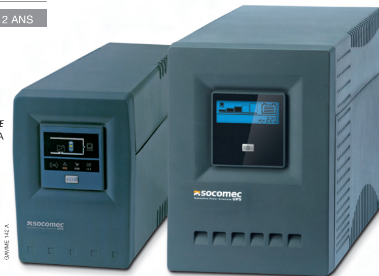
NETYS PE 1000 / 1400 / 2000 VA