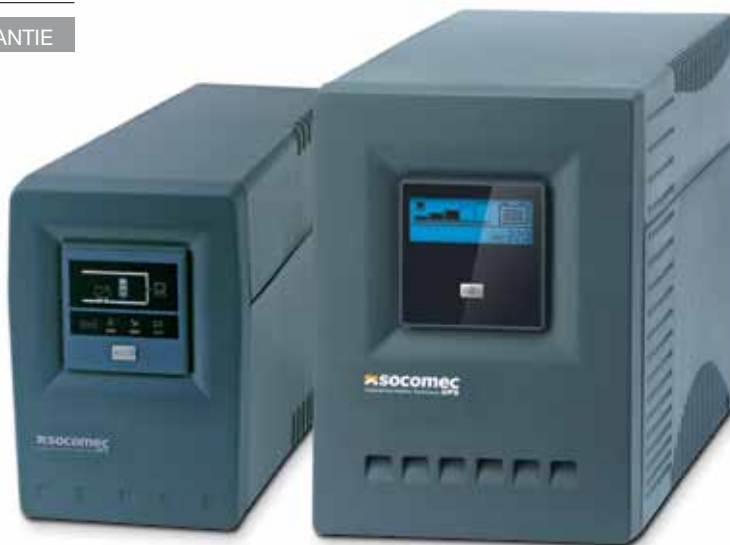
NETYS PE 1000/1400/2000 VA