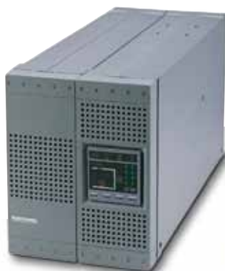
NETYS PR 1500/2000 VA