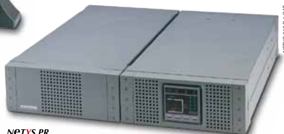
NETYS PR Rack 1500/2000 VA