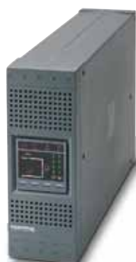
NETYS PR 1000 VA