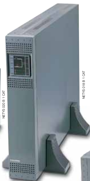
NETYS PR 3000 VA